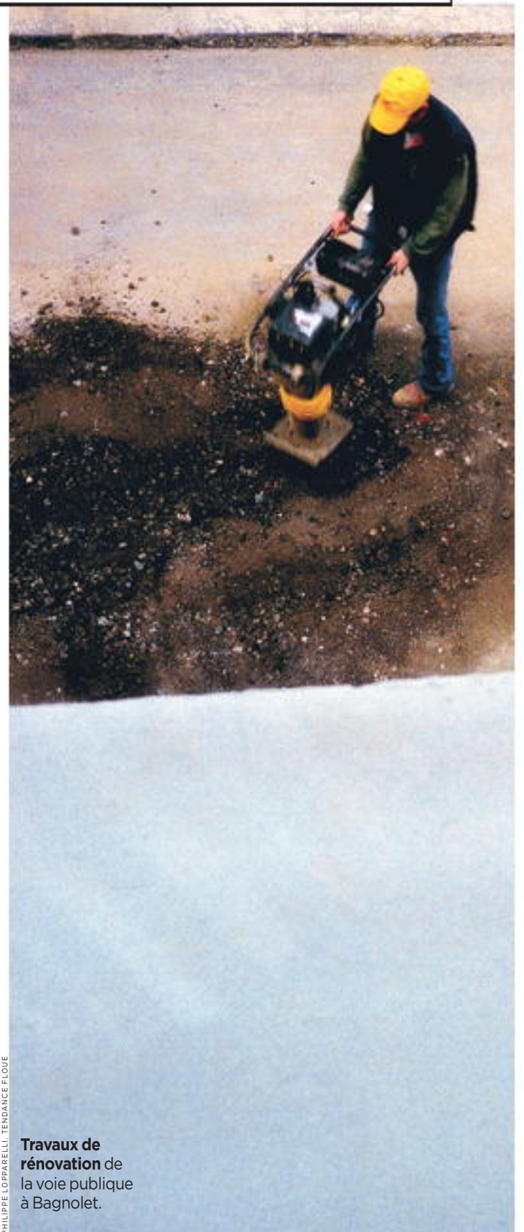
Travaux de rénovation de la voie publique à Bagnolet.

Les ouvriers sur les chantiers ne sont pas les seuls à risquer gros dans leur travail quotidien. Petite revue non exhaustive de quelques métiers bien plus risqués qu'ils n'y paraissent. Il y a les agriculteurs, qui déplacent des produits chimiques ultratoxiques sans même s'équiper de gants ni de masques, ou qui se font écraser par leurs tracteurs (lire page suivante). Il y a les marins-pêcheurs, qui, outre le risque toujours très réel de sombrer avec leur bateau, peuvent à tout moment se blesser gravement sur le pont quand la mer se creuse. Et allez dire à un pêcheur bouchonnais de mettre son harnais de sécurité pendant la pêche en Manche ou en mer du Nord, il vous enverra paître: «On a déjà le ciré sur le dos, s'il faut enfiler l'équipement de sécurité, on perd du temps pour ramener le chalut et on est moins mobile sur le pont», explique un vieux patron de pêche qui ne passe pas pour un casse-cou. Et que dire des employés des abattoirs? Perchés à deux ou trois mètres du sol sur des plates-formes métalliques roulantes, ils manipulent des carcasses sanglantes en utilisant toute une panoplie de couteaux et de scies électriques qui pendent devant eux, à portée de mains